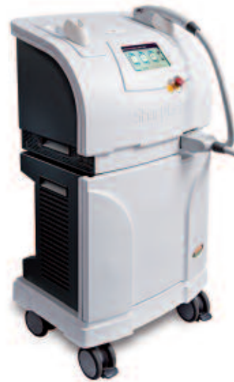
Abb. 2: Laserplattform OmniMax™.