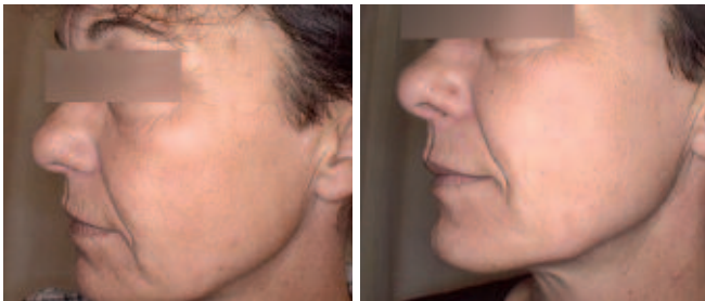
Abb. 6/7: Patientin mit signifikanten Anzeichen der Hautalterung (orange Gruppe) – Vorher/Nachher.