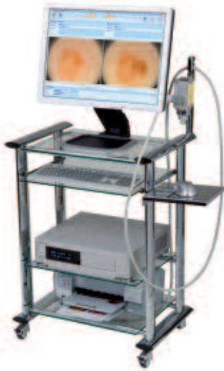
Abb. 1: Fotodokumentation der Behandlung mit FotoFinder Systems.