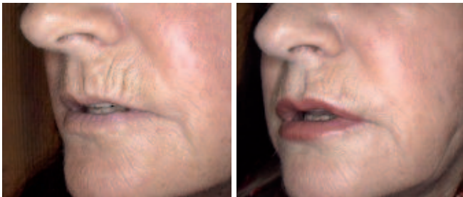
Abb. 8/9: Patientin mit schweren Anzeichen der Hautalterung (rote Gruppe) – Vorher/Nachher.